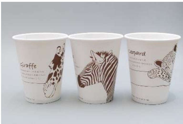
銘安科技有限公司 (香港) 展區：環保產品展區 展位編號：3-E11