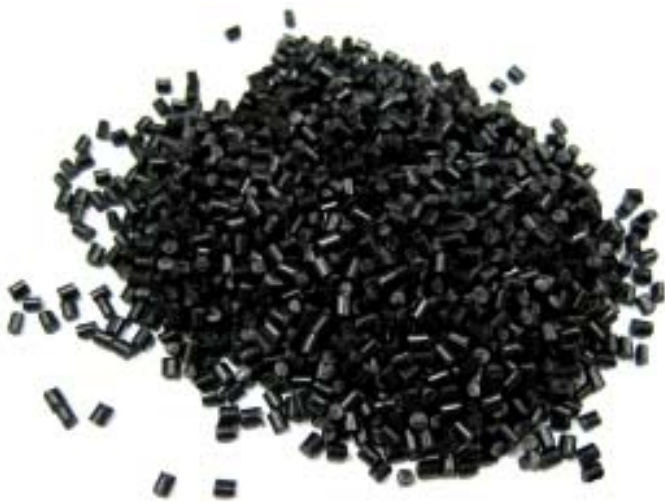
Ecoplas (HK) Limited (香港) 展區：環保產品展區 展位編號：3-D18