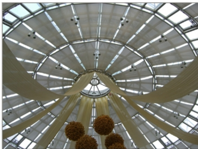
寧波先鋒新材料股份有限公司 (中國內地) 展區：環保產品展區 展位編號：3-E27