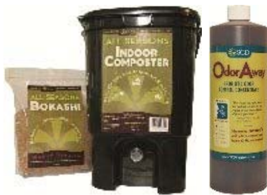
香港思達生物科技有限公司 (香港) 展區：環保產品展區 展位編號：3-D32