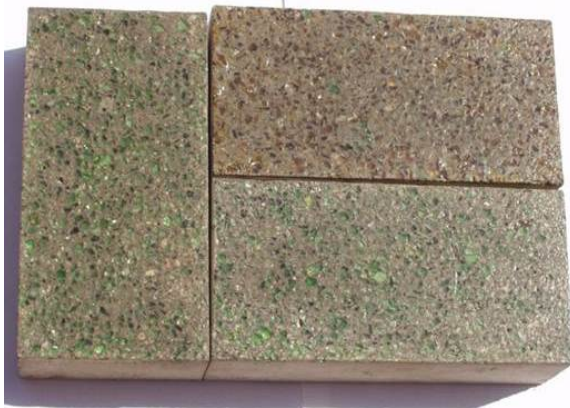
Smart Remade Technology Development Co Ltd (香港) 展區：環保產品展區 展位編號：3-E13