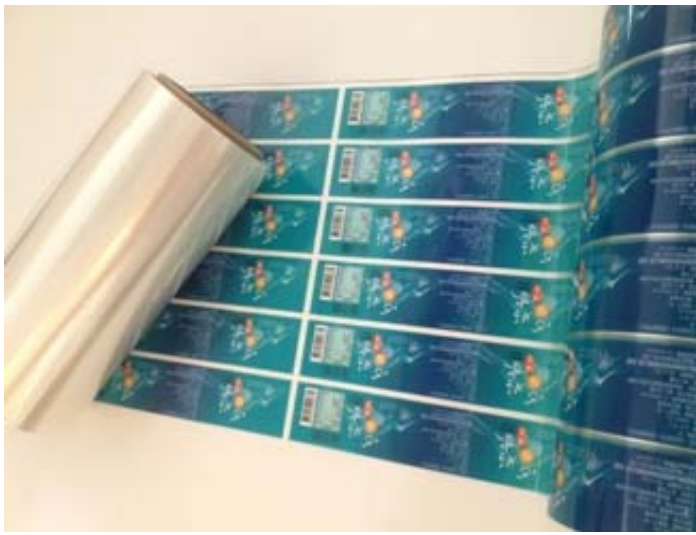
彩麗薄膜股份有限公司 (台灣) 展區：環保產品展區 展位編號：3-D36