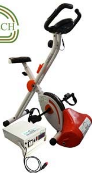
三得環復科技有限公司 (香港) 展區：能源效益及能源展區 展位編號：3-C12