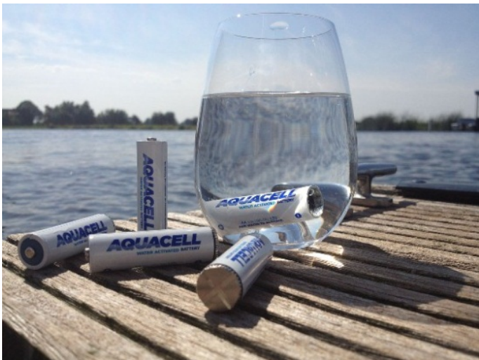
Hippo Batteries Limited (香港) 展區：環保產品展區 展位編號：3-D16